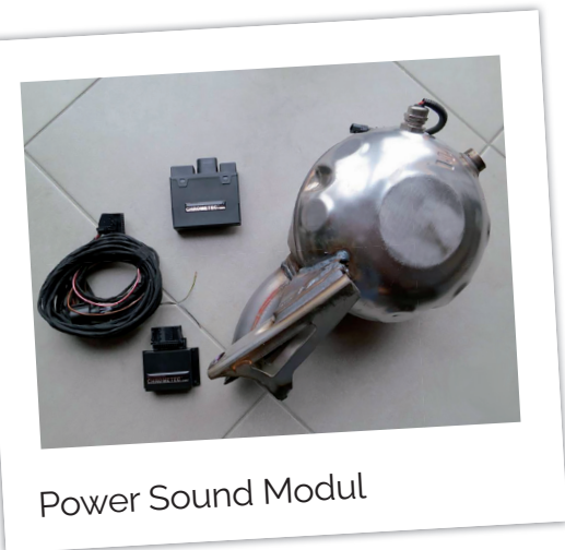
Power Sound Modul